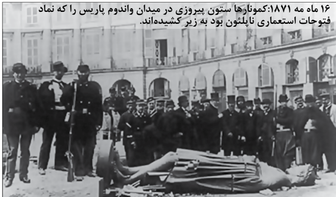
۱۶ ماه مه ۱۸۷۱: کمون‌نارها ستون پیروزی در میدان واندوم پاریس را که نماد فتوحات استعماری ناپلئون بود به زیر کشیده‌اند.

در سایت «روشنگری»، پایین سرمقاله شماره گذشته «آتش» این کامنت جلب نظر می‌کرد: «شوروی و چین هرگز جوامعی سوسیالیستی نبودند چون توسط شوراهای کارگری مدیریت نمی‌شدند.» این جمله کوتاه، بیان یک اختلاف نظر اساسی در بین کمونیست‌ها و چپ هاست که بیش از یک قرن سابقه دارد.