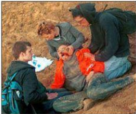
Rachel Corrie lies on the ground fatally injured by the Israeli bulldozer, Rafah, Occupied Gaza, 16 March 2003.