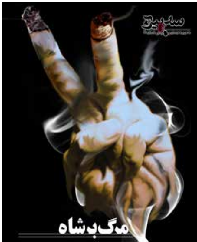
طرح جلد دو شماره از پیش‌شماره‌های سرپیچ از تولیدات جریان موسوم به چپ شورایی

«رخداد» مورد نظر بادبو می‌دانستند. مشکل خطوط عمده‌ی حاکم بر چپ شورایی این بود که سودای تغییر جهان، خارج از تضادهای واقعی اجتماعی و تاریخی را داشت. برای ایشان مبارزه نه بر اساس دیالکتیک ضرورت و آزادی و پذیرش ضرورت بیرون از اراده و خواست عنصر ذهنی و بعد تغییر جهان و تبدیل کردن آن به آزادی، بلکه طبق تمایلات فردی و ذهنی آن هم از یک خاستگاه روشنفکری خورده‌بورژوازی و فراطبقاتی بود. تناقضات ذاتی این تفکر و بن‌بست پراتیک آن در تغییر مناسبات واقعی و مادی حاکم بر جهان لاجرم آنان را به حل شدن در وضع موجود و تن دادن به قواعد بازی البته در زمین دشمنان طبقاتی پرولتاریا و زحمت‌کشان و در محدوده‌ی حفظ وضع موجود و جناح‌های گوناگون بورژوازی کشاند، گو اینکه جناح سبز شده‌ی چپ شورایی با تبلیغات کاذب پیرامون ماهیت موسوی و جریان سبز، او و نیرو و برنامه‌ی طبقاتی پشت سرش را در مسیر سرنگونی جمهوری اسلامی می‌دانست. بعدها و در جریان انتخابات سال ۸۸ و پس از آن یک گرایش قوی رفرمیستی مشابه خط حزب توده و سازمان اکثریت در هسته‌ی اصلی این جریان دیده شد که حمایت‌اش از موسوی و جریان سبز را با ماهیت اقتصادی وی توجیه می‌کرد. اینکه «اقتصاد مورد نظر موسوی نهادگرا است و از اقتصاد آزاد و نئولیبرالی مورد نظر احمدی‌نژاد مفیدتر است» البته آن‌ها نتوانستند حمایت موسوی و کروی از اصل برنامه‌ی نئولیبرالی حذف سوبسیدها را توضیح بدهند، یا اینکه «همیشه میان جمهوریت و اسلامیت نظام جمهوری اسلامی تضاد وجود داشته است و ما باید از این تضاد استفاده بکنیم» و توجیهاتی از این دست که به روشنی از خط رفرمیستی و سازش‌کارانه و ضد انقلابی حزب توده و سازمان فداییان اکثریت بر می‌آمد.