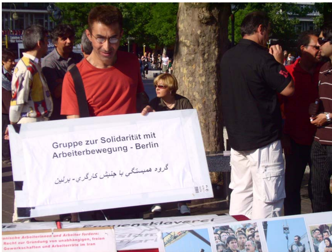
گروه همبستگی با جنبش کارگر - برلین